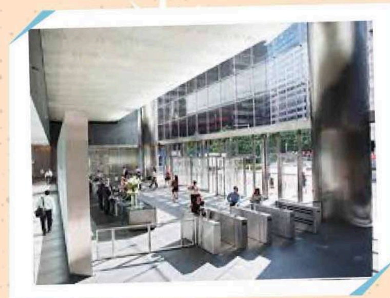
7 WORLD TRADE CENTER

313 Smith Haven Mall, Lake Grove, NY 11755