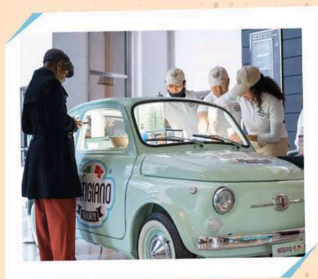
THE SHOPS AT COLUMBUS CIRCLE

Actualmente L'Artigiano se encuentra en plena expansión en Estados Unidos, con presencia en importantes centros comerciales y destinos gastronómicos. Entre sus ubicaciones actuales destacan: