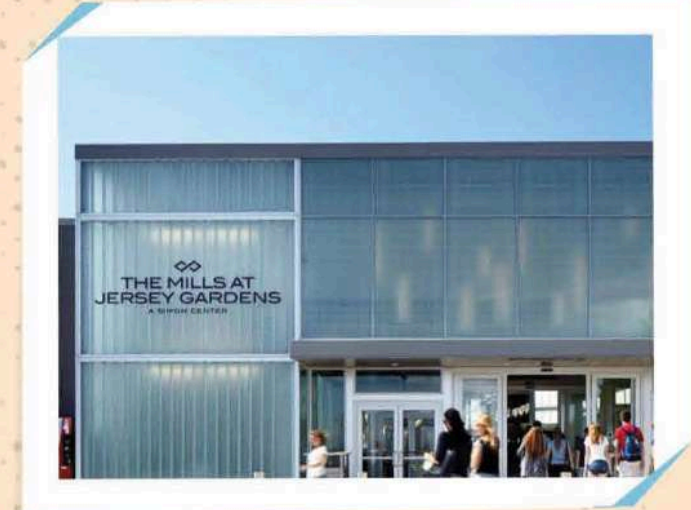
THE MILLS AT JERSEY GARDEN