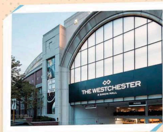
THE WESTCHESTER MALL

125 Westchester Ave, White Plains, NY 10601