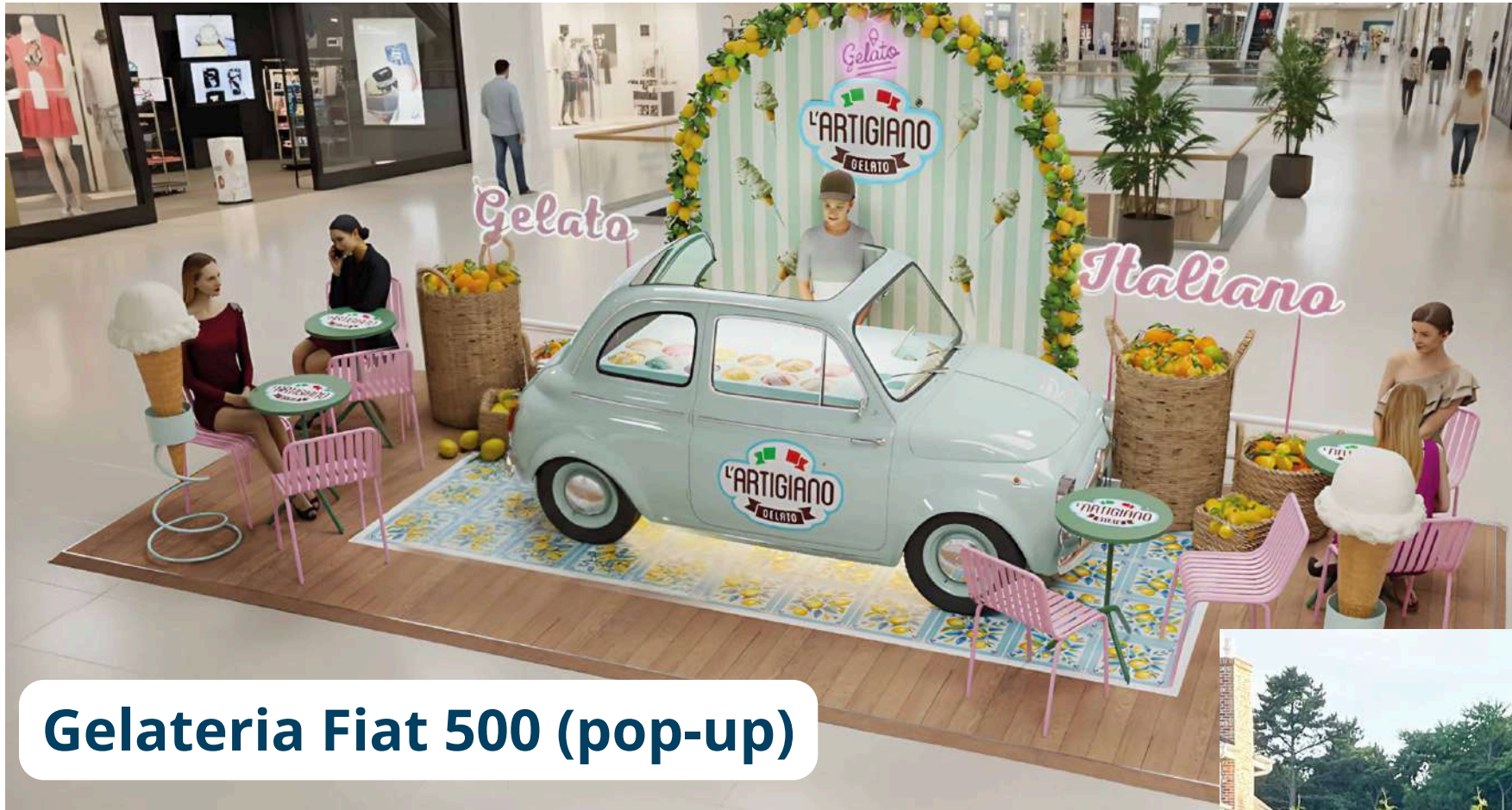
Gelateria Fiat 500 (pop-up)

El concepto puede operar en diferentes formatos: