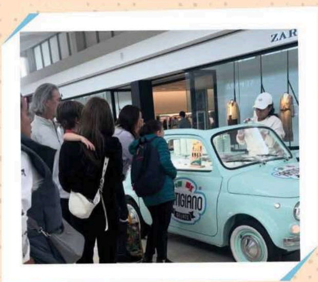
WALT WHITMAN MALL

160 Walt Whitman Rd, Huntington Station, NY 11746