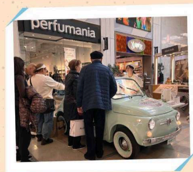
BERGEN TOWN CENTER

160 Walt Whitman Rd, Huntington Station, NY 11746