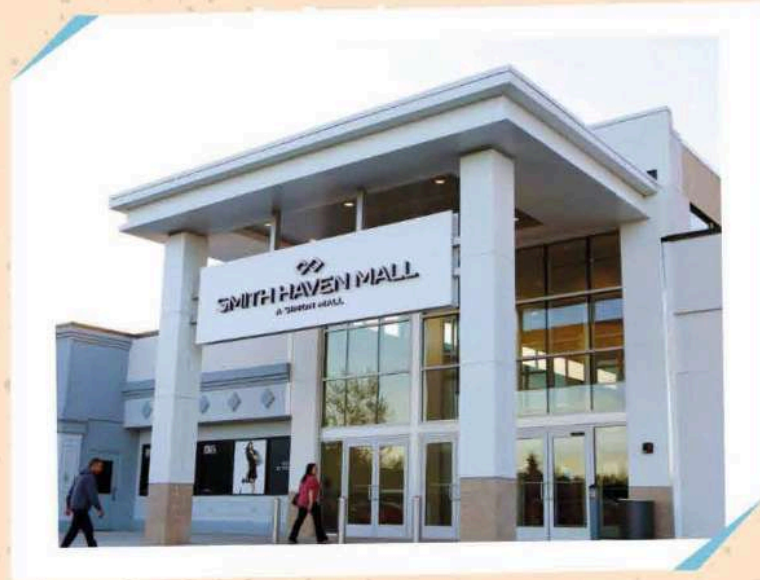
SMITH HAVEN MALL

313 Smith Haven Mall, Lake Grove, NY 11755