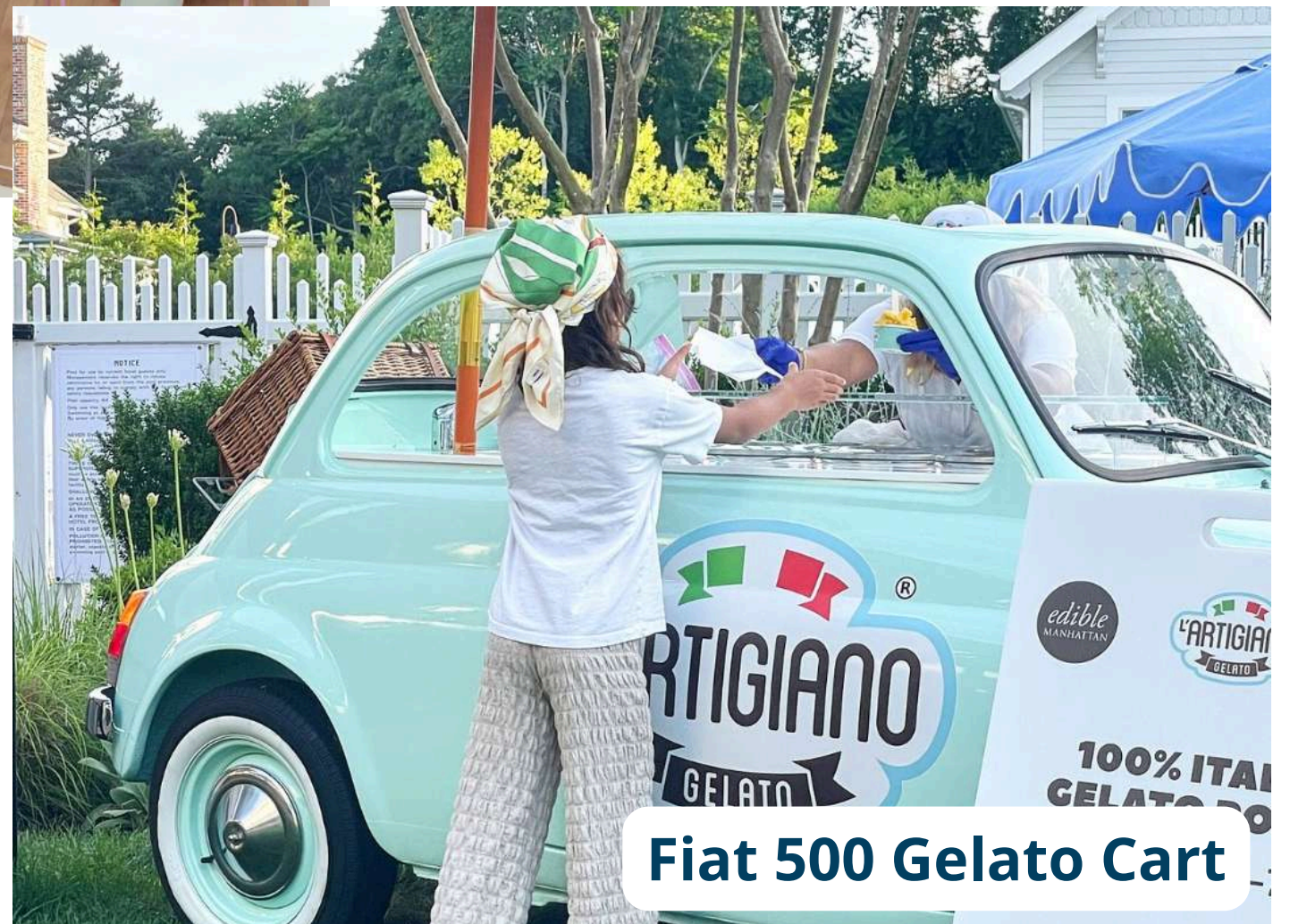
Fiat 500 Gelato Cart