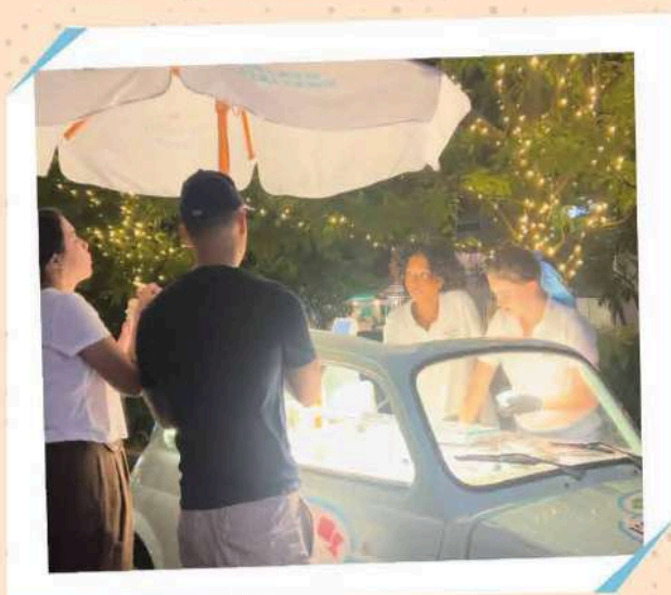
FORT LEE PARK